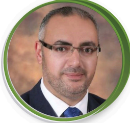
أ. معتصم أبو رمان النائب الثاني للأمين العام مسؤول الملف الوطني