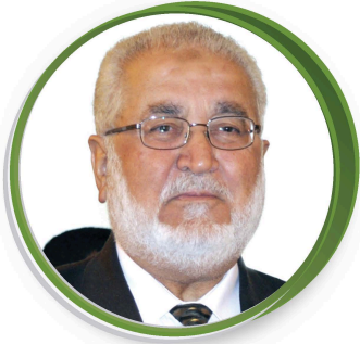
الدكتور اسحاق الفرحان (رحمه الله) ١٩٩٢ - ١٩٩٨ ٢٠٠٩ - ٢٠١٠