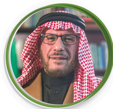
أ. أحمد الزرقان رئيس مجلس الشورى