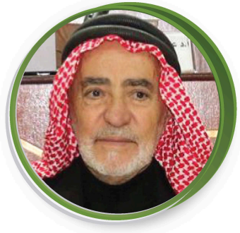
الدكتور عبداللطيف عربيات (رحمه الله) ١٩٩٨ - ٢٠٠٢