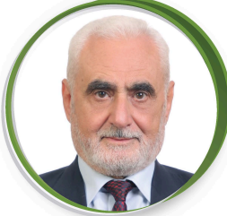
أ. جميل أبوبكر النائب الأول للأمين العام مسؤول ملف العلاقات الخارجية